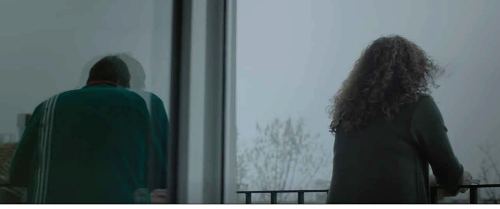
Görsel 1. Ahmet ve Elif karakterlerinin görüntüsü (Demirkubuz, 2015)

Filmin açılış sahnesinde iki karakter aynı kadraj içinde konumlandırılır; ancak kadrajı ortadan bölen cam yüzey, mekânsal sürekliliği kesintiye uğratan bir optik eşik işlevi görür. Karakterler zıt yönlerde dönük biçimde yerleştirilmiş, aralarında bir bakış hattı ya da eylem ilişkisi kurulmamıştır. Bu düzenleme, klasik duyuşal-motor şemanın işlemlerini engeller; imge, eyleme yönelen bir hareket zinciri üretmek yerine saf bir optik durum kurar. Böylece sahne, karakterler arasında bir ilişkiyi temsil etmekten çok, ilişkinin askıya alınışını görünür kılar ve filmi daha başlangıçta zaman-imej rejimine yaklaştırır.