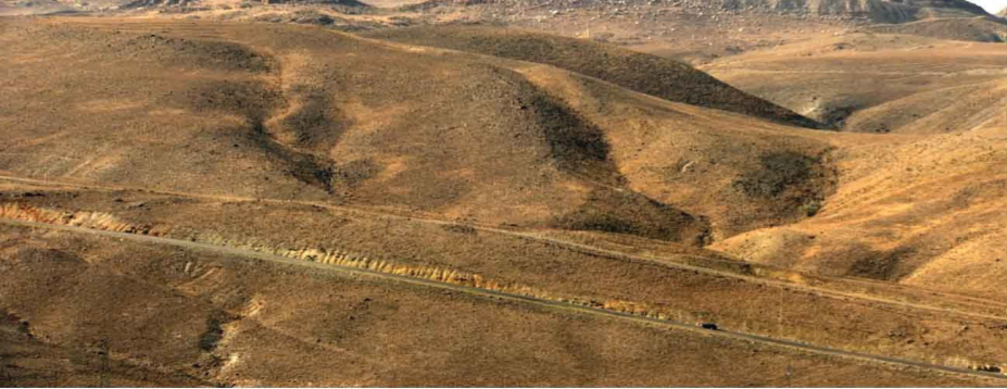
Görsel 8. Anlatı mekânına dair görüntü (Alper, 2022)

Filmin giriş bölümünde art arda gelen geniş planlar, coğrafyayı tanıtmakla kalmaz; kadrajın büyük kısmını kaplayan çıplak tepeler ve ince bir çizgi gibi uzanan yol aracılığıyla insan ölçeğini görsel olarak küçültür. Bu kompozisyon, hareket-imgenin özne merkezli ilerleyişini daha baştan zayıflatır; kadraj, bir eylemin sahnesi olmaktan çok mekânsal bir durumun kendisine dönüşür. De-