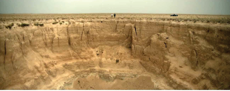
Görsel 7. Kurak Günler filminin açılış görüntüsü (Alper, 2022)

Jenerik sonrası gelen ilk imge, karakterleri anlatının merkezine yerleştirmek yerine onları kadrajın üst sınırına yaslanan iki küçük figür hâlinde konumlandırır. Kadrajın büyük bölümünü dolduran devasa obruk ise görsel alanın asıl ağırlık noktasını oluşturur. Bu ölçek tersliği, hareket-imgenin insan merkezli nedensel yapısını daha başlangıçta zayıflatır ve izleyiciyi karakter psikolojisine değil, boşluğun kendisine bakmaya zorlar. Deleuze'ün zaman-imge kavramı çerçevesinde bu uzak ve yüksek konumlanış, eylemden çok mekânsal bir durum üretir; imge bir olayın temsilini sunmaz, insan ile çevre arasındaki orantısızlığı düşünsel bir problem hâline getirir. Böylece obruğun boşluğu, yalnızca ekolojik bir veri olarak değil, izleyicide insan ölçeğinin kırılmasına dair bir düşünce uyandıran optik bir yoğunluk alanı olarak işlev görür.