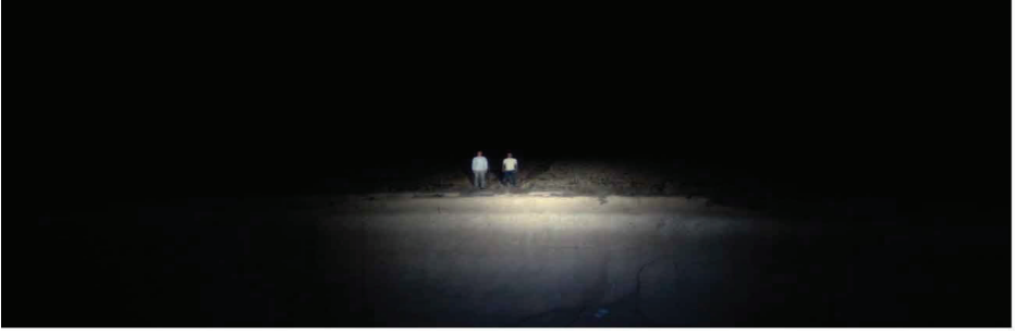
Görsel 11-12. Filmin final sahnesine ait görüntüler (Alper, 2022)