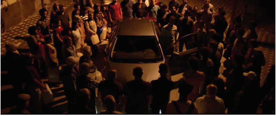
Görsel 9. Savcının aracının önünü kesen kalabalığın görüntüsü (Alper, 2022)

Filmin ilerleyen bölümünde savcı Emre ile gazeteci Murat 'ın kasabaya girişleri sırasında kalabalık tarafından araçlarının çevrelenmesi, temsilden çok bir imgesel yoğunluk üretir. Üst açıdan kurulan kadraj, bireysel öznellikleri sikkileştirir ve kalabalığı tek tek bedenlerden oluşan bir topluluk olmaktan çıkararak homojen bir kuvvet alanına dönüştürür. Bu sahne, Deleuze'ün duygulanım-imge kavramı çerçevesinde okunabilir. Eylemin henüz gerçekleşmediği, fakat potansiyel olarak yoğunlaştığı bu anlarda hareket askıya alınır ve sahne bir gerilim yüzeyine dönüşür. Kalabalığın sessiz yaklaşımı, aracın etrafında dalaran çember ve karakterlerin hareket alanının kısıtlanması, nedensel bir açıklamadan çok bir kuşatma duygusu üretir. Tehdit fiili bir saldırıya dönüşmez, ancak imge saf bir basınç ve etkilenme alanı kurar. Bu bağlamda kalabalık, su krizinin temsilden ziyade toplumsal tıkanmanın yoğunlaşmış bir imgesi gibi işler. Savcının sembolik iktidarı bu kuvvet alanı içinde askıya alınır; sahne bir olayın temsilden ziyade izleyiciyi doğrudan bir etkilenme alanına yerleştiren yoğun bir duygulanım-imge üretir.