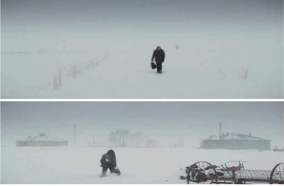
Görsel 13-14. Filmin açılış sahnesinden görüntüler (Ceylan, 2023)

Film, sabit kamera ve uzun plan tercihleriyle açılarak izleyiciyi dramatik bir hareketten çok süre deneyimine maruz bırakır. Geniş bir beyazlık içinde bir süre boş kalan kadraj, anlatıyı olaydan değil durumdan başlatır. Dolmuşun çerçeveye girişi ve Samet 'in ağır adımlarla ilerleyişi, eylemi başlatan bir dramatik jestten ziyade mekânın içinde beliren bir varoluş hattı olarak görünür. Karla kaplı yüzey yalnızca bir doğa tasviri değildir; karakterin hareketini yavaşlatan ve onu çevreleyen bir yoğunluk alanı üretir. Bu bağlamda açılış, Deleuze'ün zaman-imge kavramıyla ilişkilendirilebilir: hareket nedensel bir ilerleme değil, süre içinde ağırlaşan bir hâl olarak kurulur. Frampton'un 'film-düşünür' yaklaşımı bu sahneyi farklı bir düzlemde tamamlar. Frampton'a göre film yalnızca düşünceyi temsil etmez; kendisi düşünür. Bu açılıшта kadrajın boş kalma süresi, dolmuşun gecikmeli girişi ve karakterin mekânla birlikte görünür oluşu, yönetmenin karakter hakkında bir bilgi vermesinden çok, filmin düşüncesini kurma biçimidir. Deleuzecü anlamda imge süreyi maddileştirirken, Framptoncu anlamda film bu süre aracılığıyla düşünür. Sabit kamera burada estetik bir tercih olmaktan çıkar; hareketi değil durumu önceler. Mekân karakterin arka planı