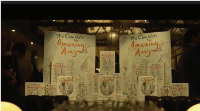
Görsel 4. 'Muhteşem Amy' sahnesi

Amy , denge içerisinde pasif, ataerkil sistemin bir parçasıdır. Ancak Nick 'in onu aldatması ile bozulan dengeyle birlikte anlatı 'kurban' kisvesi bağlamın-