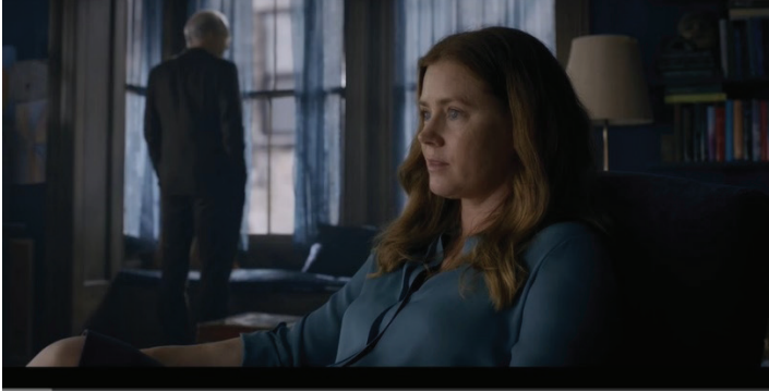
Görsel 9. Anna ve psikolog sahnesi

2. Bir olay dengeyi bozar (karakter ya da eylem): Anna 'nın karşı dairelerine taşınan Russell ailesindeki tuhaflıklar, Anna 'nın dikkatini çeker. Alistair ve Jane 'nin oğlu olan Ethan 'ın garip davranışları, Anna 'nın onların evini daha fazla