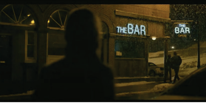
Görsel 1. Gone Girl Amy, Nick ve Andie sahnesi

2. Bir olay dengeyi bozar (karakter ya da eylem): Amy , Nick 'e açtığı bara onu almak için gittiğinde onu öğrencisi ile aldattığını görür. Böylece ondan intikam almak için tuzak kurar. Todorov'un ikinci akışı olan denormalizasyon aşamasında, çoğunlukla toplumsal normlar ya da ana karakterde sarsılma olarak karşımıza çıkar. Nick ve Amy 'nin başta mükemmel gibi görünen evlilikleri, sıradan bir Amerikan çiftinin sunduğu sakinlik ve uyum bu aşamada ters yüz olur. Bu bağlamda, sıradan olan yaşamın gerçekte ne kadar kırılgan olduğuna işaret eder. Amy 'nin kaybolmasıyla başlattığı süreçte Nick 'in hayatını kaosa sürüklemesi, salt içsel dünyasını değil, aynı zamanda evlilik ve aile gibi toplumsal yapılara da meydan okur. Domestic noir bu noktada, güvenilir alanın aslında sanılanın aksine o kadar da güven barındırmadığının altını çizer. İçsel dinamikler karmaşıklaştıkça aile değerlerinin sorgulanabilirliği artar ve aile birliğine dair normatif değerlere karşı bir eleştiri sunulur.