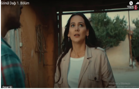
Görsel 9-10. Gönül Dağı dizisi (TRT 1, tarih yok)

Türk inanç sisteminde kutsal kabul edilen dağlar ulu, gösterişli ve ağaçsızdır. Dağlara yüklenen sembolik anlamlar ise; kudret ve irade gibi canlı varlıklara özgü mitik özelliklerdir. Dağ mitsel söylencelerin desteklediği gibi güç, kuvvet, sağlamlık, duyarlılık ve mukavemetle eşleştirilmektedir. Görsel 7-8' de yer alan görsel düzenleme ile dizide yer alan Gönül Dağı , dağlara yüklenen mitsel özellikleri vurgular biçimde kayalık ve yüksek biçimde çekilmiştir. Böylece dağ motifi mit unsurunun yanı sıra Türk toplumundaki değer yargılarına da vurgu yapmaktadır.