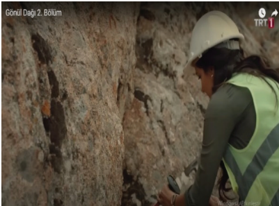
Görsel 11-12. Gönül Dağı dizisi (TRT 1, tarih yok)

Görsel 10' da ise; birbirini seven iki gencin içinde buldukları şartlar nedeniyle kavuşamayacak olmalarından dolayı taşların düşerek mağaranı ağzının kapanması gösterilmektedir. Dilek karakterinin "Gönül Dağı'ndan düşen taşların sırrı belki bu mağaradadır" demesi üzerine kayalar düşerek mağaranın girişini kapatmaktadır.