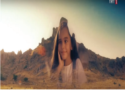
Görsel 5-6. Gönül Dağı dizisi (TRT 1, tarih yok)

Gönül Dağı dizisinde çekim yapılan dağın görüntüsü, dağa yüklenen kutsal ruh anlamı ile örtüşecek biçimde ulu gösterilmiştir. Bu görüntüye dizi içerisinde de sık sık yer verilmektedir. Görsel 3 'te etrafındaki diğer dağlardan farklı duruşu ve yüksekliği ile Gönül Dağı 'na yüklenen mitsel anlam yapılan üst aç çekim ve görsel çerçevelemeyle pekiştirilmektedir. Görsel 4 'te ise; "Yaşlı Dede" (hikâye anlatıcısı) tarafından dağa yüklenen ruhsal güç torunlarına (gelecek nesillere) aktarılmaktadır. Yaşlı Dede dağa bakarak anlattığı hikâyesinde kameranın çerçevelediği alan içerisine sözü edilen yüksek dağ da ulu bir şekilde yer almaktadır. Bu bağlamda hikâye anlatıcısını görüntüleyen teknolojik hikâye anlatıcısı televizyon ekranından ile iki katmanlı bir anlatım gerçekleştirilmektedir.