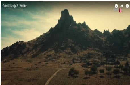
Görsel 7-8. Gönül Dağı dizisi (TRT 1, tarih yok)

Hikâye anlatılarında ilgi çekiciliği artırmak için eklenen aşk hikâyelerine Gönül Dağı dizisinde de yer verilmiştir. Dizide olay örgüsü Gönül Dağı yakınlarındaki kasabada doğan ve çocukluklarını burada birlikte geçiren fakat ayrılmak durumunda kalıp yıllar sonra tekrar aynı yerde buluşan iki genç üzerinden kurgulanmaktadır. Gönül Dağı hakkında anlatılan mit ile gençlerin bugün yaşadıkları aşk hikâyesi birbiriyle örtüşürken, beşinci ve altıncı görsellerde vurgulandığı gibi Gönül Dağı 'nı tüm ululuğuyla gösteren hayal ve buluşma sahnelerindeki görsel düzenlemeler aşklarının büyüklüğünü de destekleyecek biçimde gösterilmektedir.